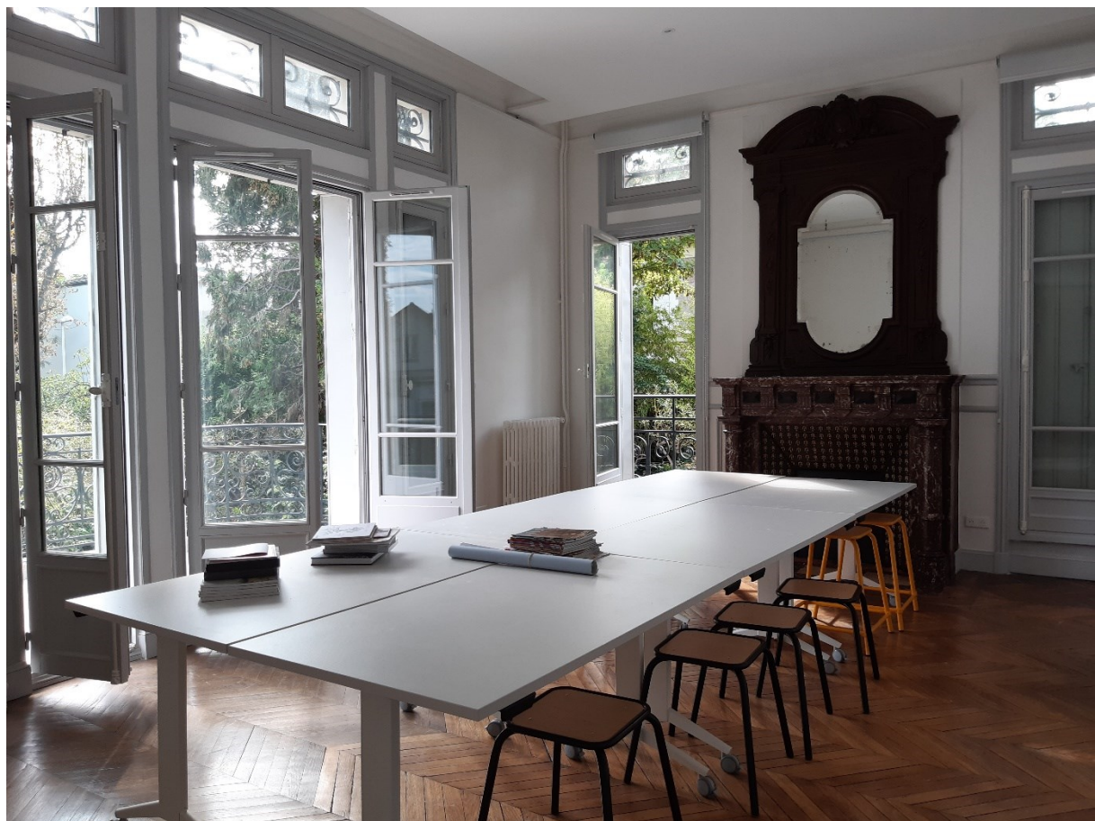
Espace de restitution, présenté ici sans les cimaises