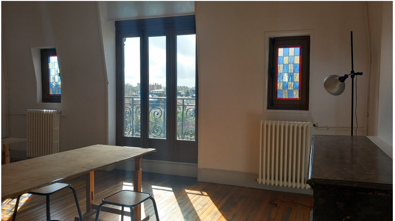
Atelier pour résident n° 2