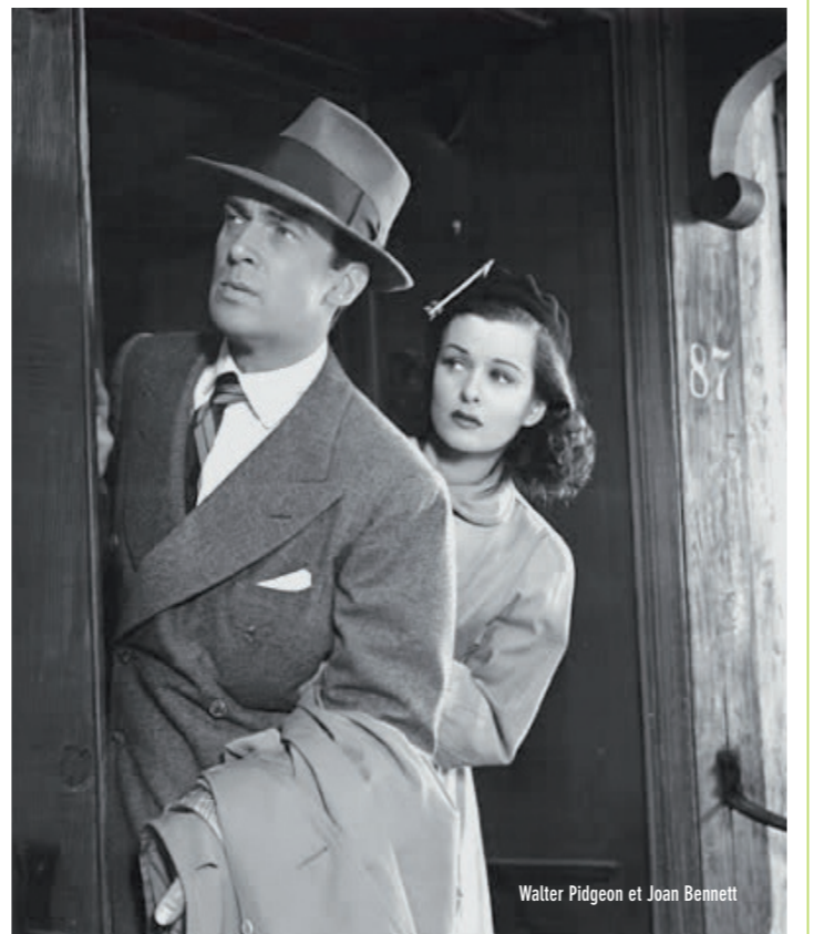
Walter Pidgeon et Joan Bennett

MAN HUNT (CHASSE À L'HOMME) (EN VOSTFR) Film britannique de Fritz Lang (1949). 1h38. Thriller, guerre Avec WALTER PIDGEON, JOAN BENNETT, JOHN CARRADINE Thorndyke, amateur de chasse anglais, tient Hitler au bout de son fusil à lunette. Capturé avant d'avoir pu faire feu, il parvient à s'échapper. De retour en Angleterre, des nazis le traquent. Il décide de retourner en Allemagne pour en finir avec le Führer. Dim. 12 mai à 18h