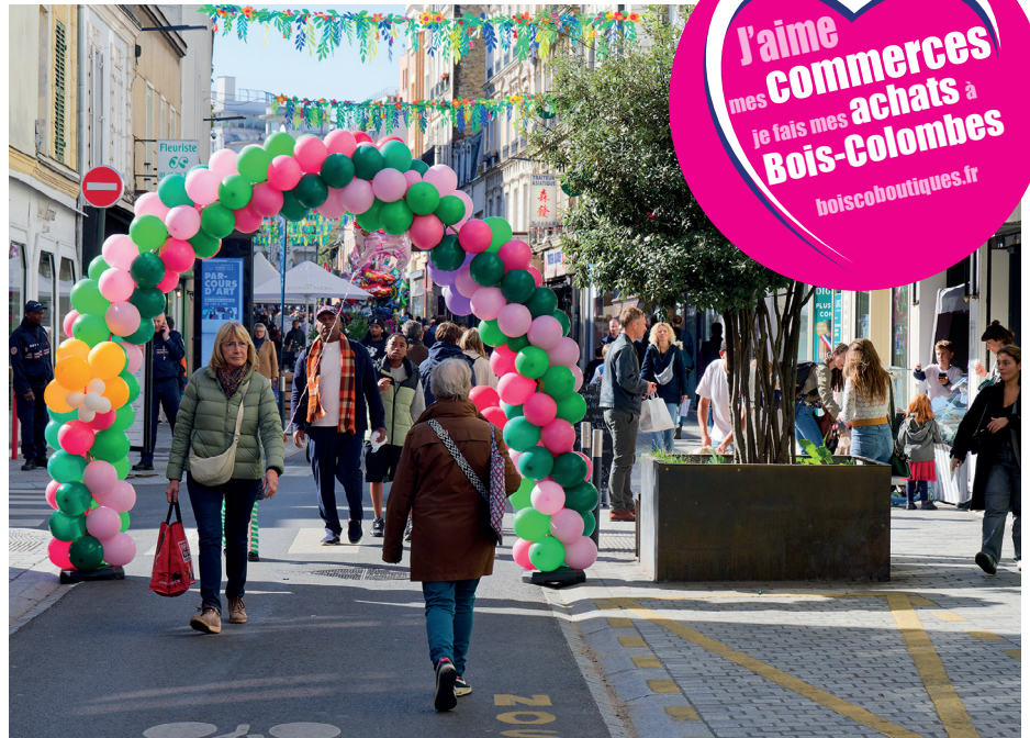
Professionnels, collectivité et habitants, nous sommes tous acteurs du maintien et du développement du commerce de proximité de qualité sur notre territoire.

Métropole du Grand Paris « Centres-villes vivants » et la foncière privée De Watou, spécialisée dans le commerce et la revitalisation des villes moyennes françaises (répartition du capital ci-contre).