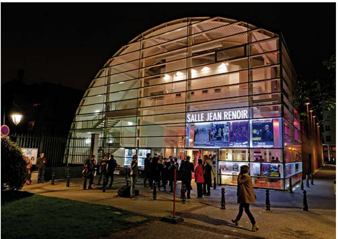
La salle Jean-Renoir et ses 360 places..

Ce dossier vous présente le programme de la manifestation et les moyens mis en œuvre pour la réussite de cette semaine spéciale « Film d'animation ».